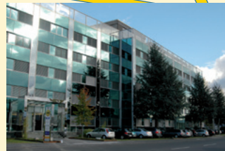
KlinikRente VERSORGUNGSWERK Robert-Perthel-Straße 4